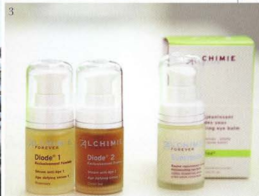
1. 治療室にもアートが飾られ落ち着いた雰囲気に 2. エントランスを入ったところの待合スペース 3. ルイジ&バーバラ夫妻が開発する製品はフォーエバー・アルキミーとして販売される。男性用、女性用、男女兼用のものがある